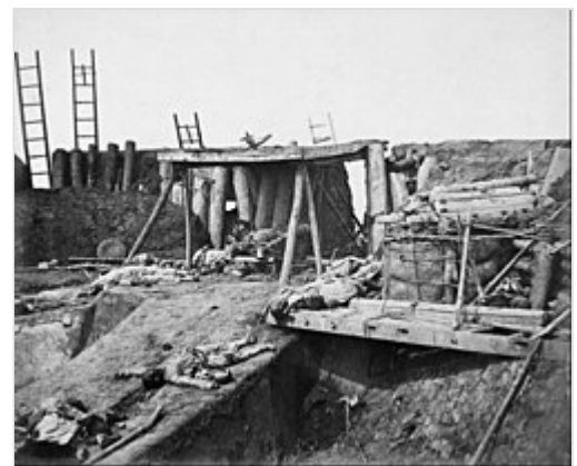
Die Festung Dagou nach der Einnahme □ durch britische und französische Truppen

1. Kanton – French Folly Fort – Humen – Barrier Forts – Fort Macao – Escape Creek – Fatshan Creek – 2. Kanton – 1. Taku-Forts – 2. Taku-Forts – 3. Taku-Forts – Zhangjiawan – Baliqiao